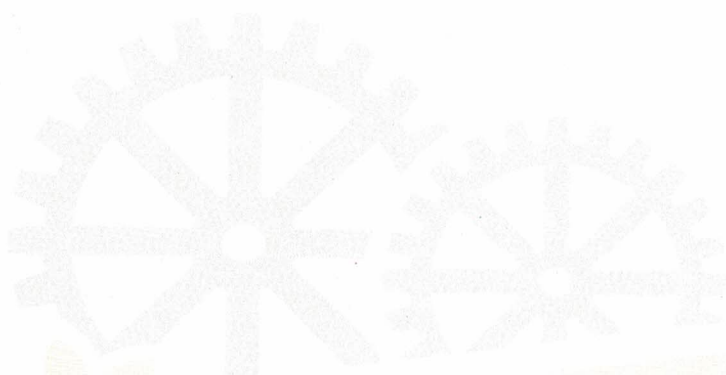
Flávio Vieira Gadelha de Albuquerque Prefeito.